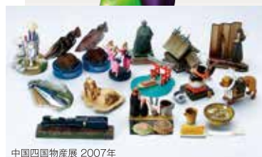
中国四国物産展 2007年