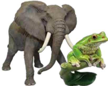
アフリカゾウ 1993年 松村しのぶ

アニメのヒーローやヒロイン、ロボット、怪獣などのキャラクターは、80年代のフィギュア草創期から現在まで、常にフィギュアの中心的モチーフとなっています。時代とともに変化し、現在も進化を続けるキャラクターフィギュアの世界をご紹介します。