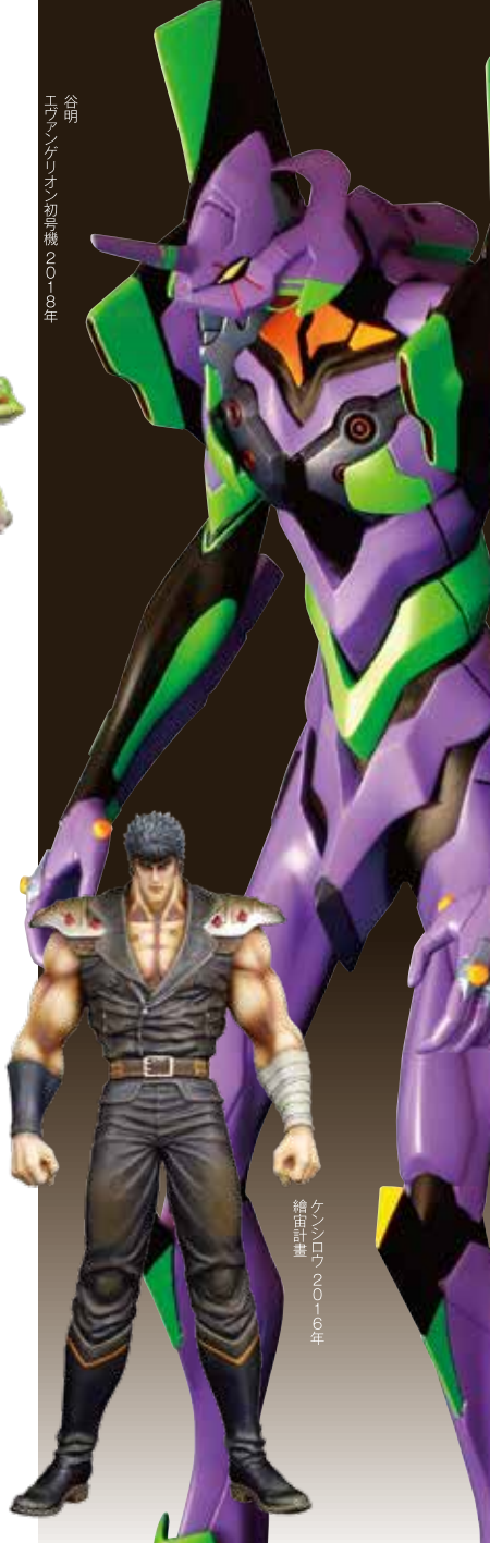
エヴァンゲリオン 初号機 2018年

釧路市生涯学習センター まなぼとと幣舞 MANABOTTO NUJUMAI 幣舞 釧路市立美術館 Kushiro City Museum of Art 〒085-0836 釧路市幣舞町4番28号 TEL 0154-42-6116 FAX 0154-41-8182