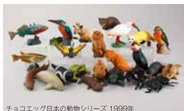
チョコエッグ日本の動物シリーズ 1999年

博物館モデルは博物館や美術館から依頼を受けて制作された公式モデルのことで、高い完成度が求められます。海洋堂の博物館モデルは手のひらサイズながら、他に類をみない正確なディテールと質感を実現し、大英博物館や東京国立博物館など、数多くの施設の公式モデルとして採用されています。