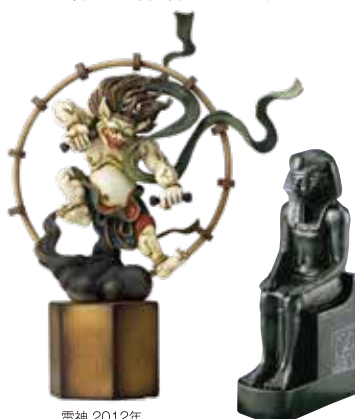
雷神 2012年 竹谷隆之

恐竜や動物などのネイチャーモデルの分野において、その再現性や表現力が世界的に高く評価されている海洋堂。ニューヨーク自然史博物館をはじめ、国内外の博物館からの復元模型の制作依頼が来るほどの高い完成度を誇っています。