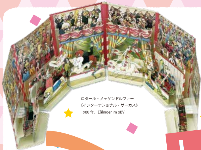
ロタール・メグゲンドルファー 《インターナショナル・サーカス》 1980年、Eßlinger im öBV