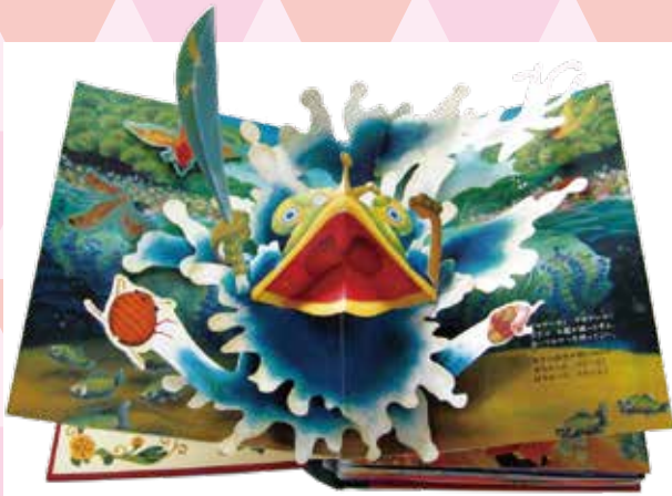
さくらひろし《パコと魔法の絵本 ガマ王子VSザリガニ魔人》 堀米けんじ作、2008年、主婦と生活社