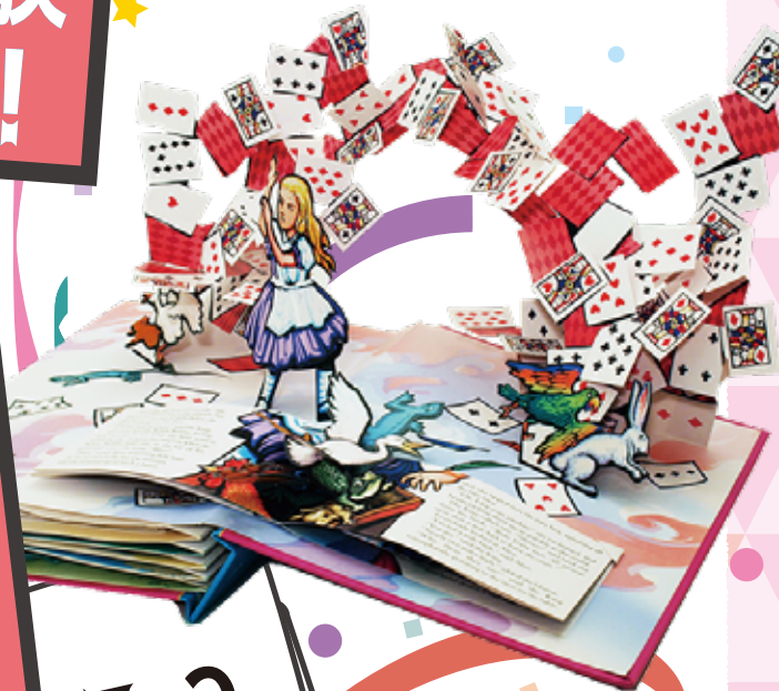
ロバート・サブダ 《不思議の国のアリス》 ルイス・キャロル原作、 2003年、LITTLE SIMON