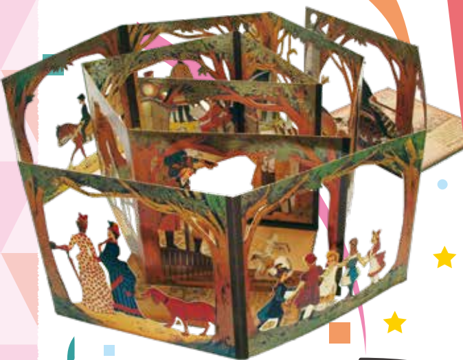
ロタール・メグゲンドルファー 《都市公園》 1980年、 William Collins Sons & Co.Ltd.