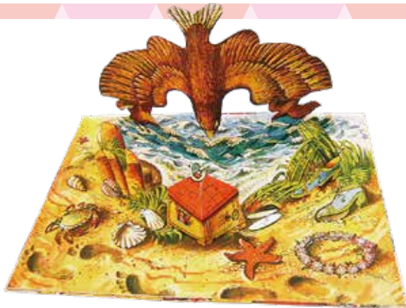
ヴォイチェフ・クバシュタ《巨人の国のガリバー》 ジョナサン・スウィフト原作、1950年、BANCROFT & Co.Ltd.