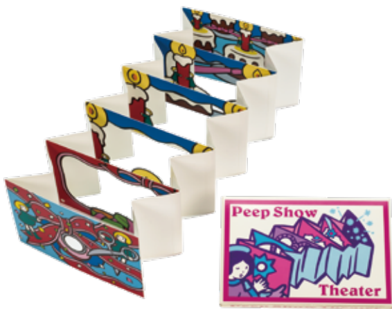
吉田穂美《ピープショー・ケーキ・キャンドル》 2009年、プラクティカルアドバンス・エフ