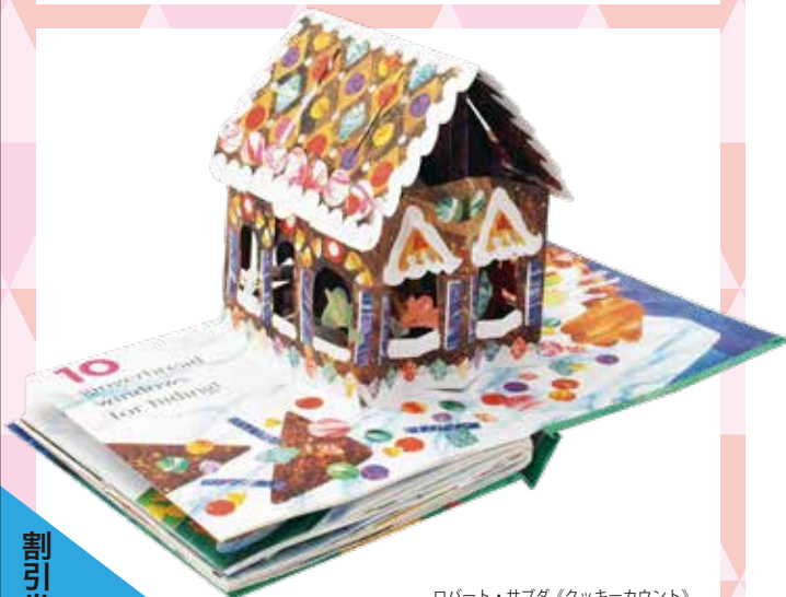
ロバート・サブダ《クッキーカウント》 1997年、LITTLE SIMON

ページをめくると絵が飛び出たり、つまみを引っ張ると絵が動く…。様々な仕組みで読者を引き付けるしかけ絵本を紹介します。