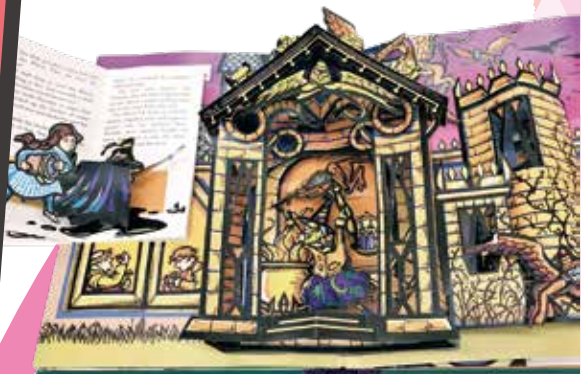
ロバート・サブダ《オズの魔法使い》 ライマン・フランク・ボーム原作、 2000年、LITTLE SIMON