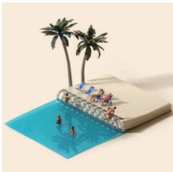
リアルなメモ=メモリアル