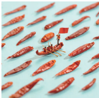
辛さもレースもヒートアップ!