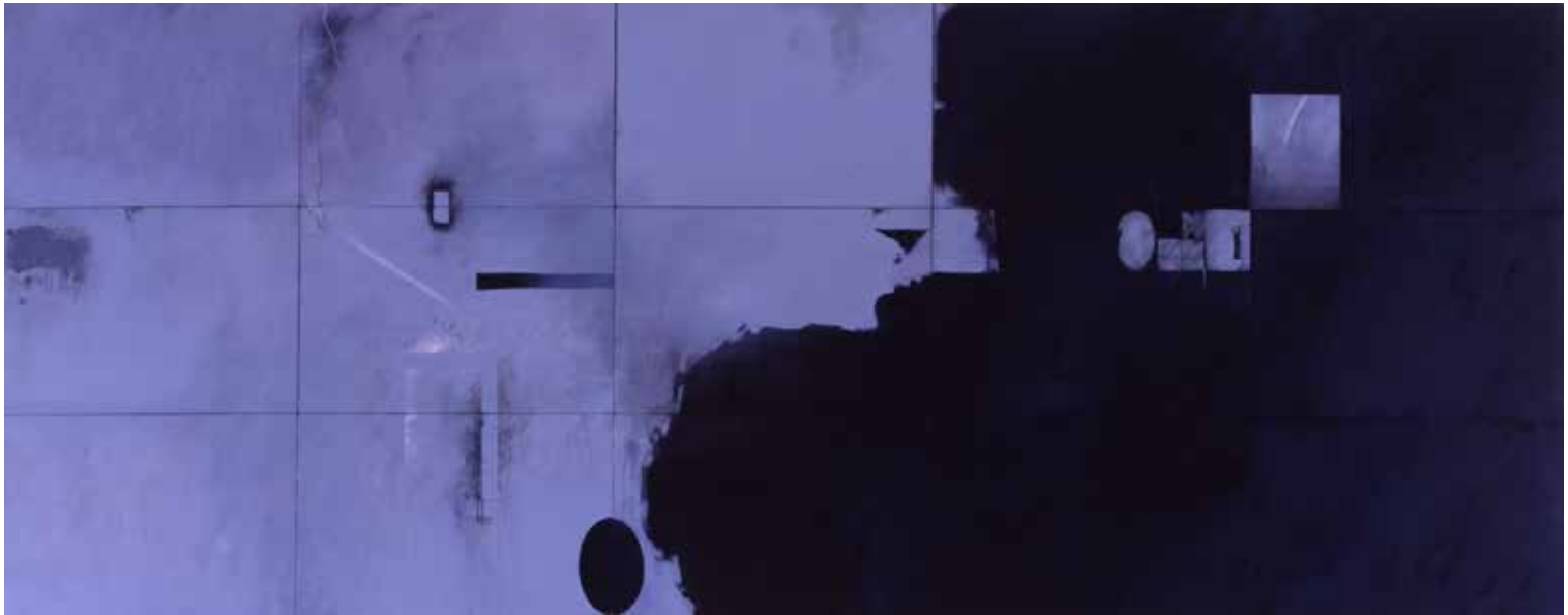
流れ・痕跡 1987 1987年 油彩・カンヴァス 札幌芸術の森美術館蔵

本展では、初期作品から「大気・振動」、「IN FLOOD」シリーズに至る大作をまとめてご紹介するとともに、これまで描き続けた油彩、水彩など合わせて約60点を展示し、半世紀以上にわたる画家の制作活動を振り返ります。