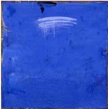
ドルフィンストリート・朝 1980年 油彩・カンヴァス 北海道立近代美術館蔵