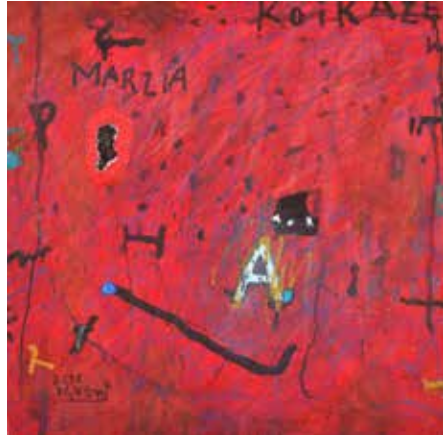
MARZIA 2011年 油彩・カンヴァス 個人蔵