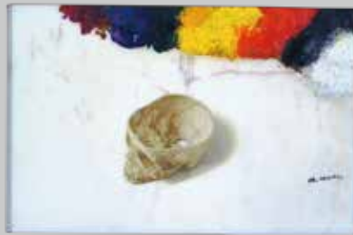
野田弘志のパレット