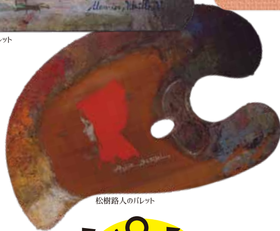
松樹路人のパレット