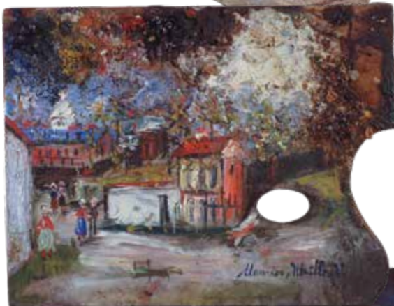
モリス・コトリロのパレット