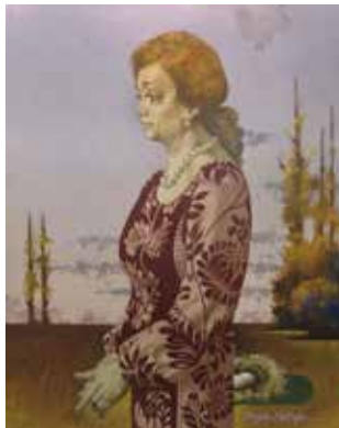
松樹路人《地平の肖像》2007 年