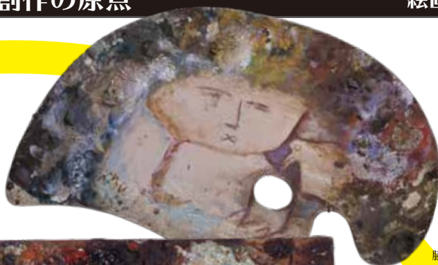
脇田和のパレット