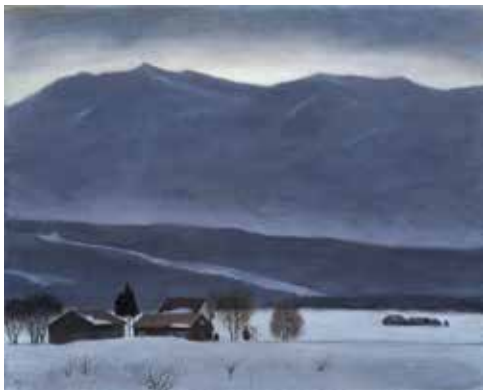
相原求一朗《雪の朝》1995zzzh 年

ピカソ、コトリロなど海外作家に加えて、梅原龍三郎や安井曾太郎、林武など近代の巨匠、また現在も活躍する画家たちの作品（+パレット）を展示。ボリュームたっぷりの内容となっています。