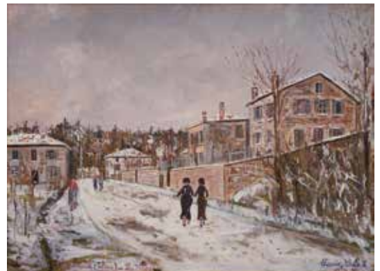
モリス・コトリロ《ブル＝レ＝ゼシャルモ（ロース）》1934 年