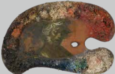
鴨居玲のパレット