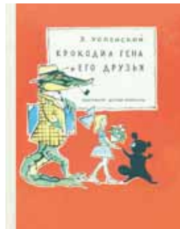
ワレリー・セルゲーヴィチ・アルフェエフスキー 『ワニのゲーナとおともだち』 1966年 絵本（初版）

大きな耳と茶色の毛、つぶらな瞳。でもどこか哀愁を帯びた雰囲気をまとうチェブラーシカ。1966年旧ソ連にてエドゥアルド・ウスペンスキーが執筆した童話『ワニのゲーナとおともだち』に初めて登場し、1969年、パペット・アニメの巨匠ロマン・カチャーノフ監督によってアニメーション化されると、その愛らしい姿が大人気となりました。