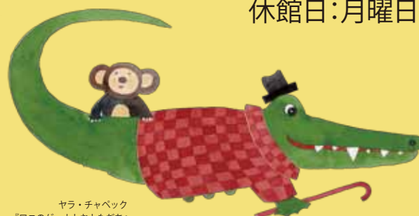
ヤラ・チャベック 『ワニのゲーナとおともたち』 2005年 挿絵・原画

主催 釧路市民文化展実行委員会、釧路市立美術館、 公益財団法人釧新教育芸術振興基金、釧路新聞社 後援 ロシア文化フェスティバル組織委員会、ロシア連邦文化省、駐日ロシア連邦大使館、 ロシア連邦協力庁、FM くしろ、(一財)釧路市民文化振興財団 協賛 アートギャラリー協力会 協力 チェブラーシカプロジェクト、ロシア国立映像博物館、平凡社 企画協力 株式会社イデッフ