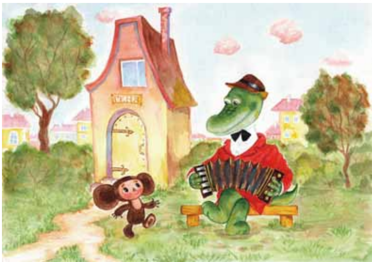
タチャーナ・ウスヴァイスカヤ 『チェブラーシカ・ワニのゲーナとおともだち』 2002年 挿絵・原画

©2010 Cheburashka Movie Partners/Cheburashka Project