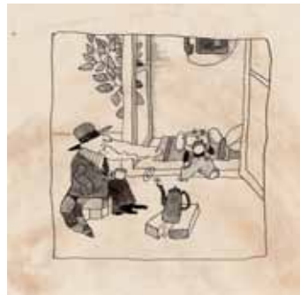
ゲナディ・カリノフスキー 『ワニのゲーナとおともだち』 1977年 挿絵・原画