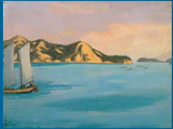
溝谷国四郎<櫃石島の帰帆>1932年