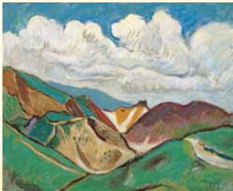
北川民次《八幡平》1957年

アメリカ合衆国で生まれた国立公園の理念や手法を取り入れ、日本でも国立公園設置に向けた啓発活動を行うため、候補地を絵画で紹介する「国立公園洋画展覧会」が企画されました。当時を代表する洋画家たちに絵画制作委嘱を行い26点が完成。1932(昭和7)年に東京や大阪などで展覧会が開催され大好評を博しました。その後、1934(昭和9)年に日本において初めて国立公園が指定されます。以降も各地の国立公園指定に合わせ絵画も随時追加され、最終的には80点のコレクションとなりました。