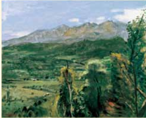
中村研一《大雪山》1934年