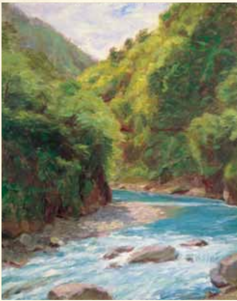
山下新太郎《黒部峡谷鐘釣附近》1932年