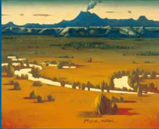
松樹路人<湿原の夕映え>1988年